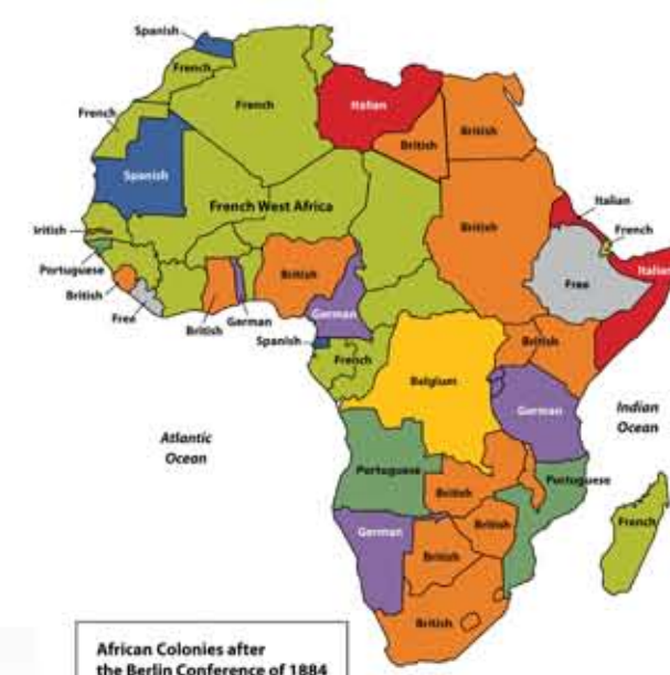
African Colonies after the Berlin Conference of 1884

Sizce Merkezi bir Güç-Akıl olmadan bütün bu ülkelerin yaklaşık aynı tarihlerde serbest bırakılmaları mümkün müdür?