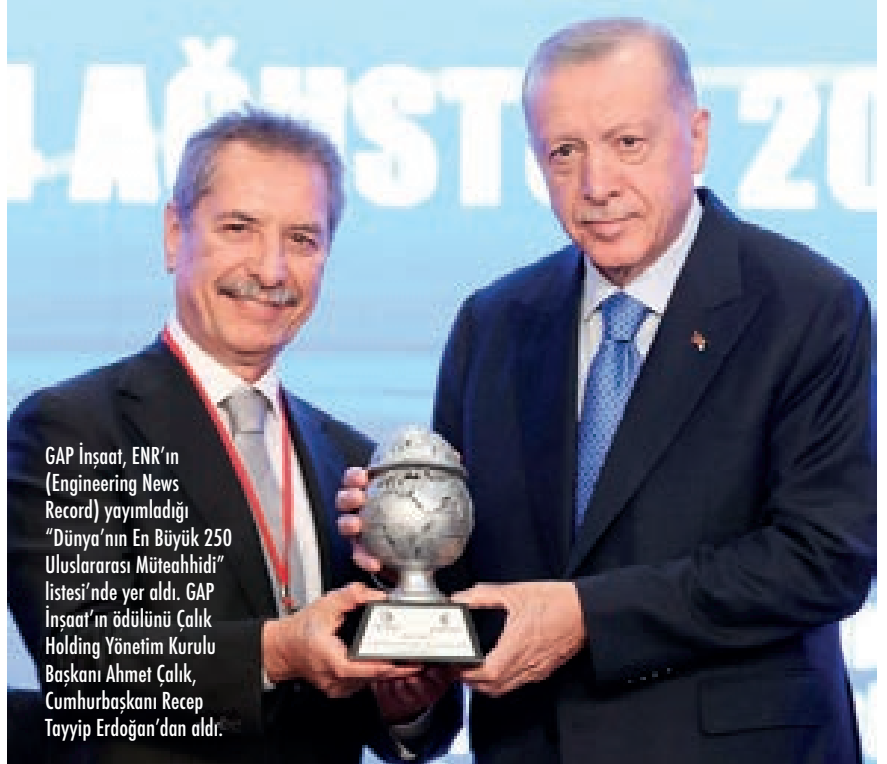
GAP İnşaat, ENR'in (Engineering News Record) yayımladığı "Dünya'nın En Büyük 250 Uluslararası Müteahhidi" listesi'nde yer aldı. GAP İnşaat'ın ödülünü Çalık Holding Yönetim Kurulu Başkanı Ahmet Çalık, Cumhurbaşkanı Recep Tayyip Erdoğan'dan aldı.

Üç kıtada toplam 6.28 milyar USD değerindeki 135 projeyi başarıyla tamamlayan GAP İnşaat, Amerikan ENR Dergisi'nin her yıl açıkladığı 'Dünyanın en büyük müteahhitleri' sıralamasında 2006'dan bu yana kesintisiz yer alıyor. Dünyanın saygın ve prestijli taahhüt şirketleri arasında yer alan GAP İnşaat, 1996 yılında kuruldu. Genel merkezi İstanbul'da bulunan GAP İnşaat, benimsediği 'İnsana Değer, Geleceğe Değer' mottosuyla sürdürülebilir bir gelecek inşa etmek için 3 kıtada birden projeler yürütüyor. Bugüne kadar kontrat değeri 6.28 milyar USD olan 135 ayrı projeyi başarıyla tamamlayan GAP İnşaat, halen devam eden 3 ayrı projesi üzerinde çalışıyor. 'Geleceğin Mühendisliği' kavramını odağına alan GAP İnşaat; profesyonel yönetici kadrosu, her biri konusunda uzman çalışanları, yurtiçinde ve yurtdışında anahtar teslim iş yapabilme becerisi ve başarıyla gerçekleştirdiği projeleriyle geleceği bugünden inşa ediyor.