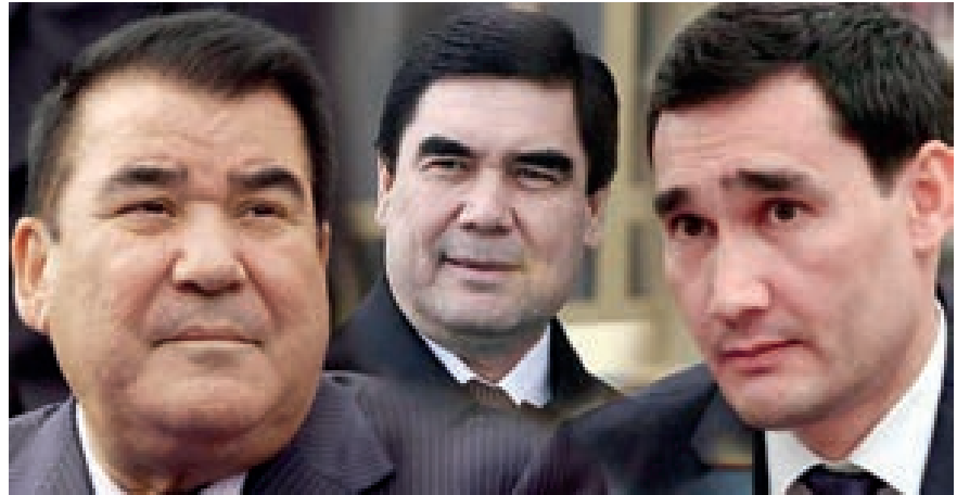
SAPARMURAT TÜRKMENBAŞI - GURBANGULİ BERDİMUHAMEDOV - SERDAR BERDİMUHAMEDOV

Saparmurat Türkmenbaşı'ndan sonra devlet başkanlığı görevine gelen Gurbanguli Berdimuhamedov ise Türkmenistan'da bir çok ilke imza attı.